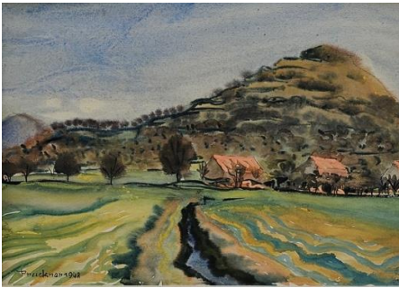
Limburg bei Weilheim an der Teck, Aquarell 1948