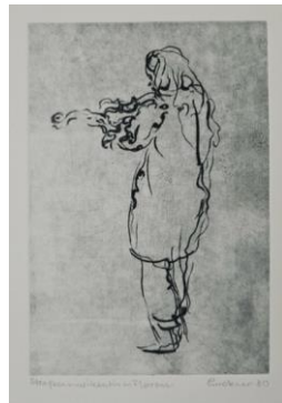
Straßenmusikantin in Florenz Radierung 1980