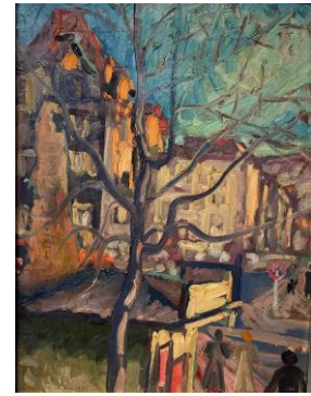
Stuttgart, Ecke Rothebühl- Herzogstraße, Ölbild ca. 1970