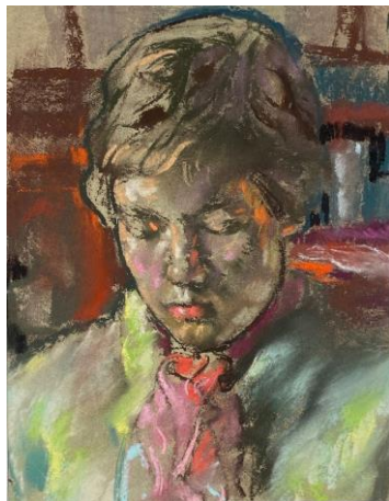
Mit rotem Schal, Pastell 1958