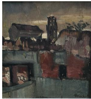
Stuttgart, Blick zur Feuerseekirche, Ölbild 1970